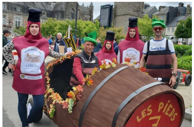
Photo 2023 : la « caisse » des 7 pieds de vignes

En 2023, elles avaient fait grincer leurs roues dans les virages et valdinguer les bottes de paille : le Comité des fêtes de Saint-Sever remet les gaz ce dimanche 9 juin, à partir de 14 heures , dans les rues du centre-bourg, au départ de la place de la mairie. Cette 2 ème édition de course folklorique de caisses à savon sera « encore plus folle que la première », annoncent les organisateurs, forts du succès rencontré l'an passé. On estimait à 2500 le nombre de personnes dénombrées sur l'ensemble de la journée, comprenant également le vide-greniers organisé parallèlement place du champ-de-foire (voir ci-dessous). En 2023, 27 équipages – issus d'associations et de collectifs d'habitants – avaient pris part à l'épreuve : la participation devrait être sensiblement la même, dimanche.